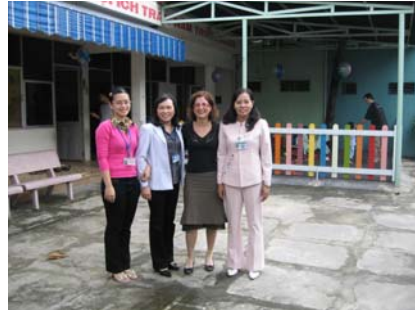
Directora del orfanato y dos representantes del ministerio de asuntos exteriores