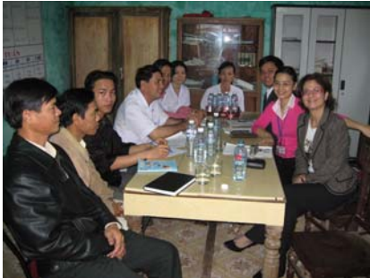
Trabajadores del orfanato

Fotografías tomadas en Village of Hope en la provincia de Danang city (Vietnam). Tomadas en un orfanato de niños malnutridos, abandonados, con síndrome de down o víctimas de la bomba de agente naranja.