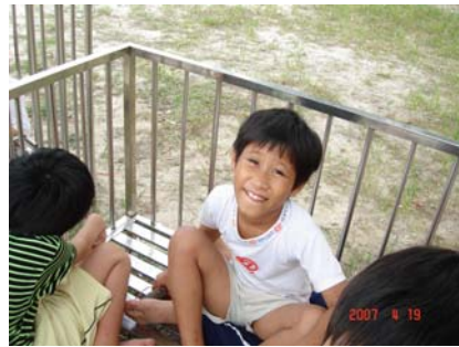
Huérfanos o abandonados