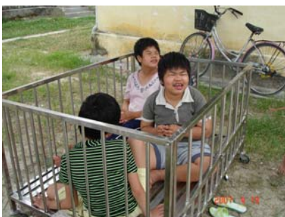
Huérfanos o abandonados