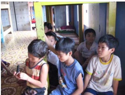
Huérfanos o abandonados