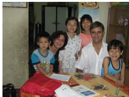
En el orfanato