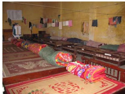
Una de las habitaciones del orfanato